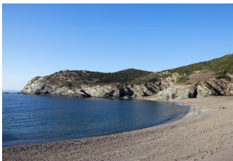
5° POSTO - Alghero