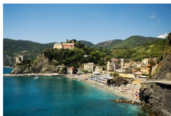
8° posto - Monterosso al Mare