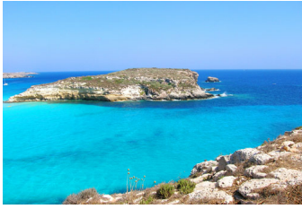
3° POSTO - Lampedusa