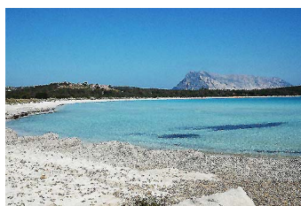
7° POSTO - San Teodoro