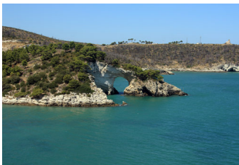
4° POSTO - Vieste